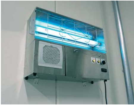
オリジナル吸引式捕虫器

また、防虫対策やカビ対策、オリジナル吸引式捕虫器の展示の他、ダクトクリーニング、排水管洗浄の実演を行います。