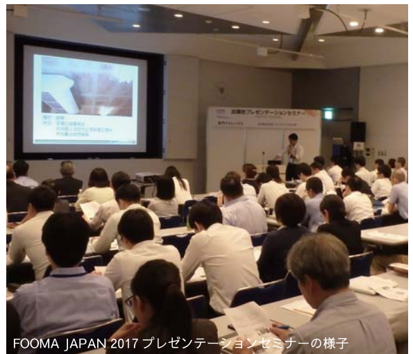
FOOMA JAPAN 2017 プレゼンテーションセミナーの様子