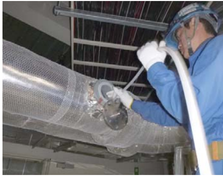
ダクトクリーニング