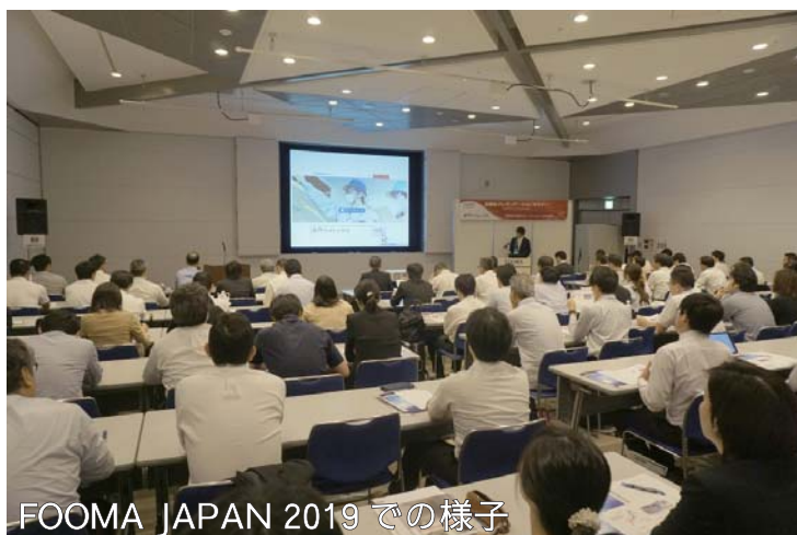
FOOMA JAPAN 2019 での様子