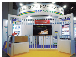
FOOMA JAPAN 2023での様子

日時 ..... 2024年6月4日(火)～6月7日(金) 時間 ..... 10:00～17:00 会場 ..... 東京ビッグサイト 東展示棟1～8ホール 弊社ブース番号..... 4C-05(東4ホール) 住所 ..... 〒135-0063 東京都江東区有明3-10-1 アクセス ..... https://www.bigsight.jp/visitor/access/ ご来場方法 ..... FOOMA JAPAN 2024公式WEBサイトより 「来場事前登録」をしていただき、クイックパス(入場バッジ)を 出力のうえ会場へお持ちください。