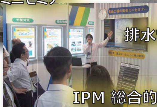
IPM 総合的有害生物管理