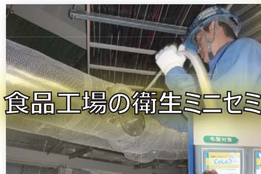
食品工場の衛生ミニセミナー

また、ブースでは実際のダクトクリーニングや排水管洗浄施工のデモンストレーションを行う他、ミニセミナーを実施し、より具体的に弊社のサービスをご説明させていただきます。