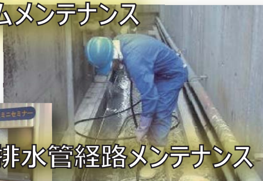
排水管路メンテナンス