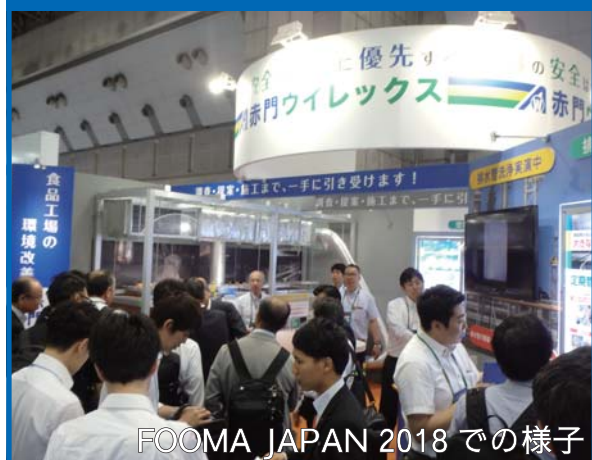
FOOMA JAPAN 2018 での様子