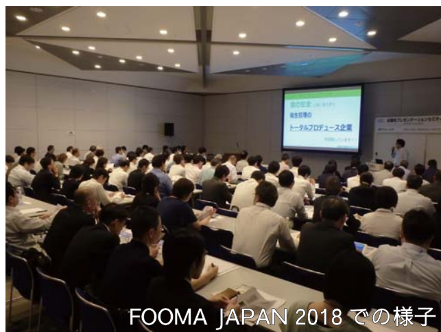
FOOMA JAPAN 2018 での様子