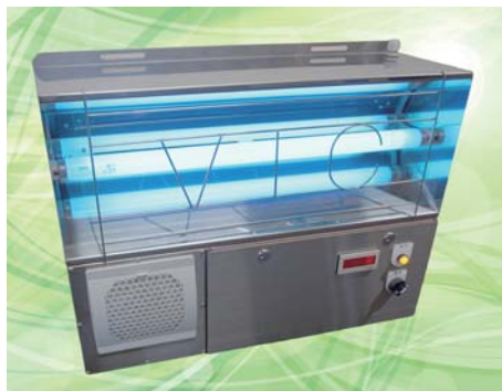
オリジナル吸引式捕虫機 VIC

私たち赤門ウイレックスは「食の安全はすべてに優先する」と題し、食品メーカーの皆様が抱える終わりのない「食の安全・安心の確保」に向けた取り組みのサポートとして、空調管理の重要性や計画的なメンテナンス、モニタリングなど未来に向けて今行うべき重要項目を、ブース内で行うミニセミナーや実演などによりご紹介いたします。是非ご来場ください！