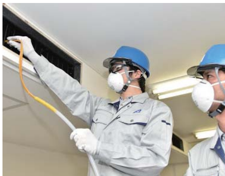
ダクトクリーニング